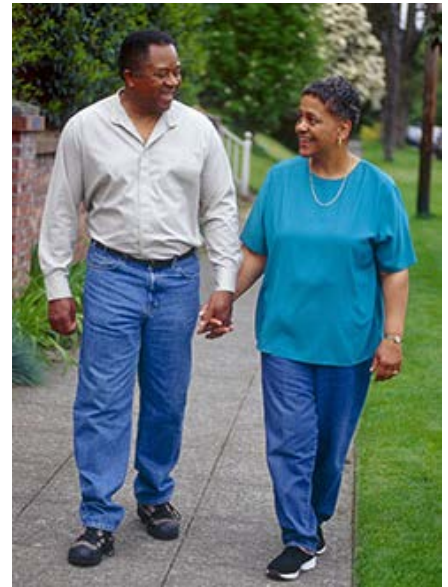
Recovery takes time. Be sure to resume activity slowly.