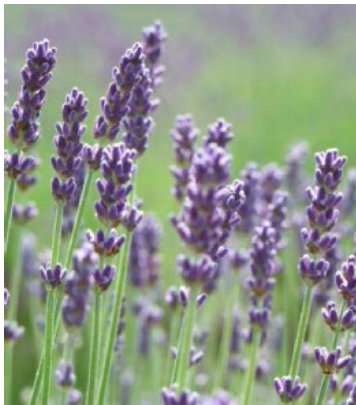
យើងសង្ឃឹមថាព័ត៌មានក្នុង អត្ថបទនេះមាន ប្រយោជន៍នៅពេលលំណាក។