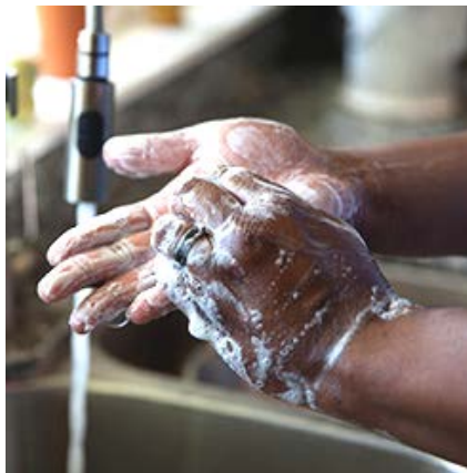
Dùng xà phòng và nước rửa tay ít nhất 20 giây.