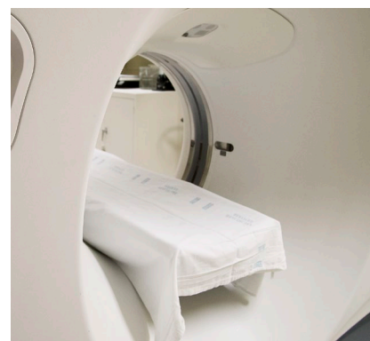
For your scan, you will lie on a table inside the CT machine.

For the scan, you will lie on a table inside the CT machine. The X-ray tube will revolve around you and take pictures from many angles, forming cross-section images ( slices ) of the area. Your doctor will view the images on a computer.