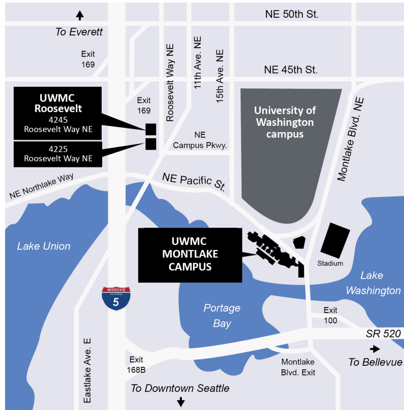
UWMC - Montlake 및 UWMC Roosevelt 클리닉의 위치.