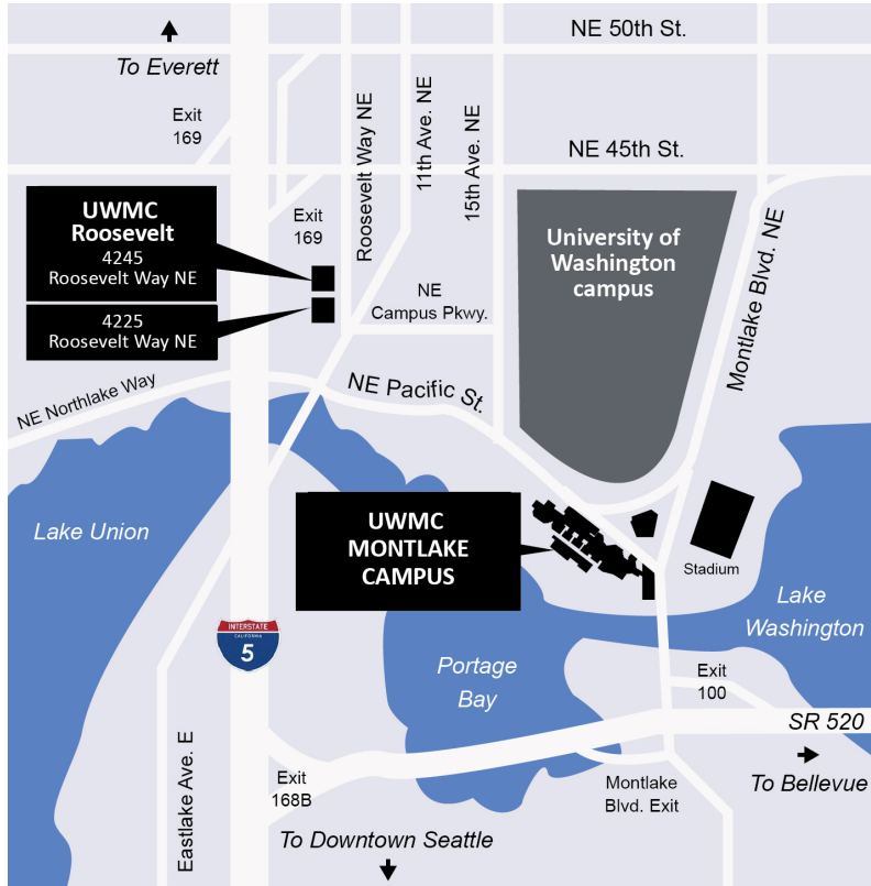
Locations of UWMC - Montlake and UWMC Roosevelt Clinics.