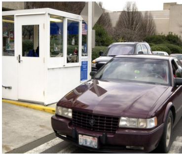
Valet parking at the main hospital is available weekdays, 8 a.m. to 5 p.m.