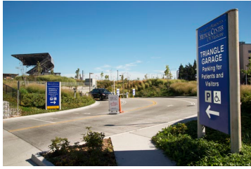
Entrance to the Triangle Parking Garage.