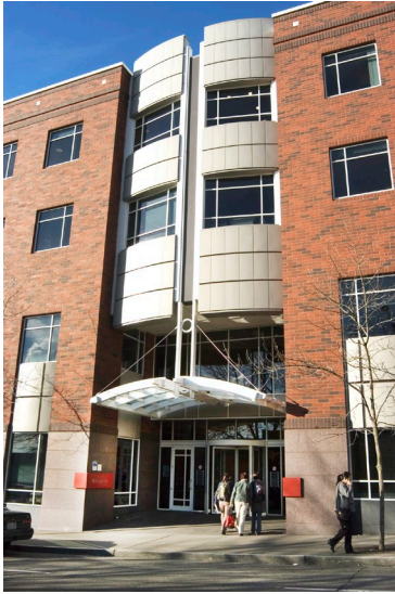
Entrance to one of the UWMC - Roosevelt clinic buildings.