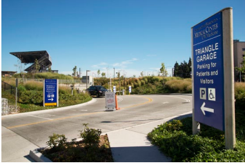
Въезд в гараж «Triangle Parking Garage».