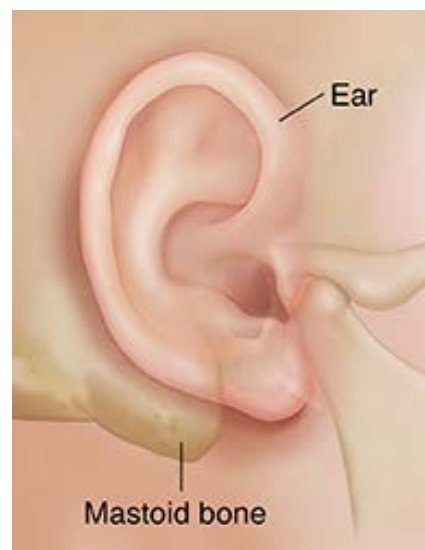
The mastoid bone is just behind and under the ear.

This surgery may be done when the ear is infected, but the infection has not gone away after being treated with antibiotics. Your surgeon will remove the infected tissue.