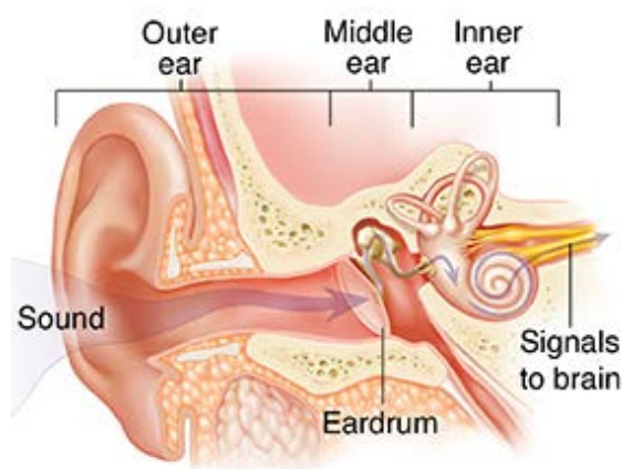
The eardrum is in the middle ear.