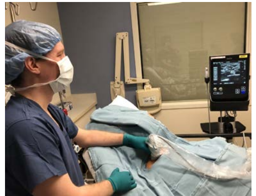
A member of our Anesthesia team giving a patient a nerve block.