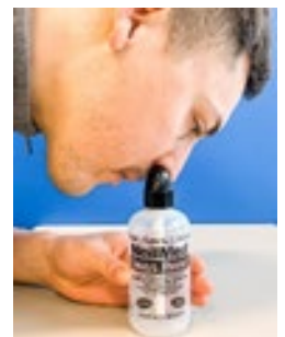
Do your sinus rinse