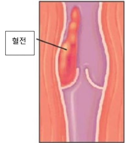
정맥 안의 혈전.