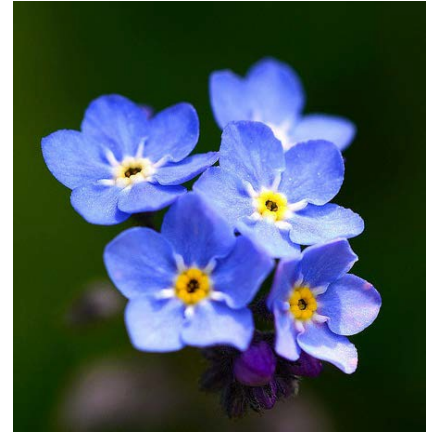
We are very sorry for your loss.

Families and friends of a patient who has died in the hospital have questions. They want to know what happens after the death, what hospital staff and family members need to do, and how to find the resources they need.